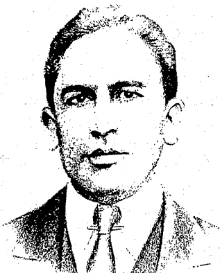
BEATO DAVID ROLDAN LARA