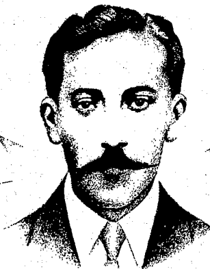
BEATO MANUEL MORALES